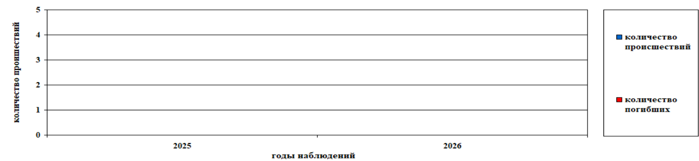
Сравнительный анализ происшествий, гибели людей на водных объектах области 2025-2026 гг.