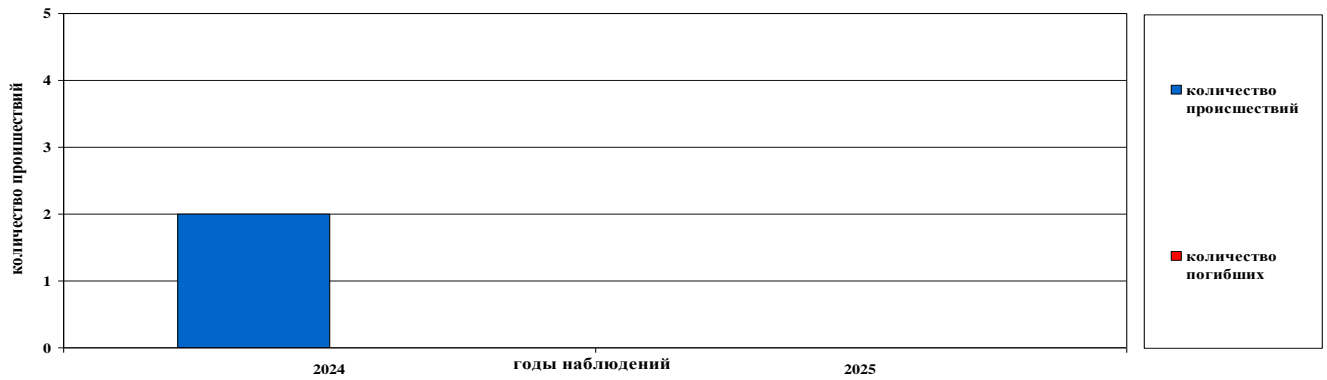
Сравнительный анализ происшествий, гибели людей на водных объектах области 2024-2025 гг.