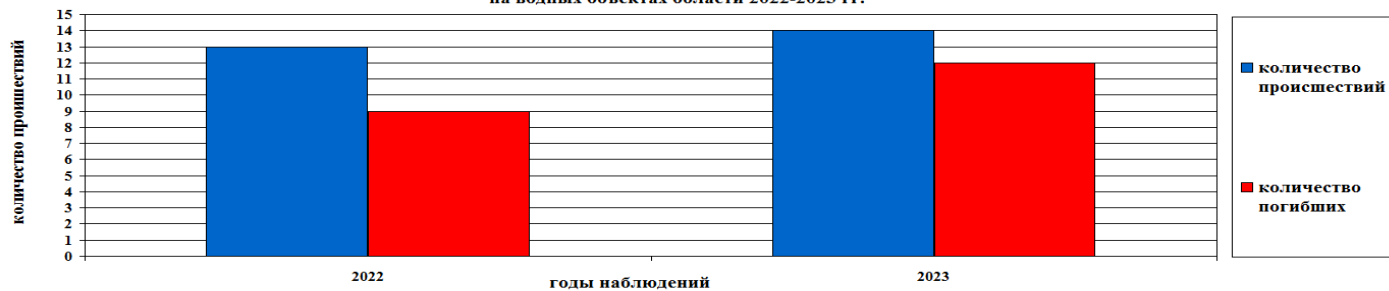
Сравнительный анализ происшествий, гибели людей на водных объектах области 2022-2023 гг.