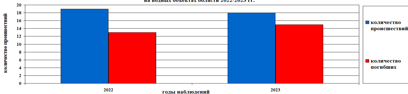
Сравнительный анализ происшествий, гибели людей на водных объектах области 2022-2023 гг.