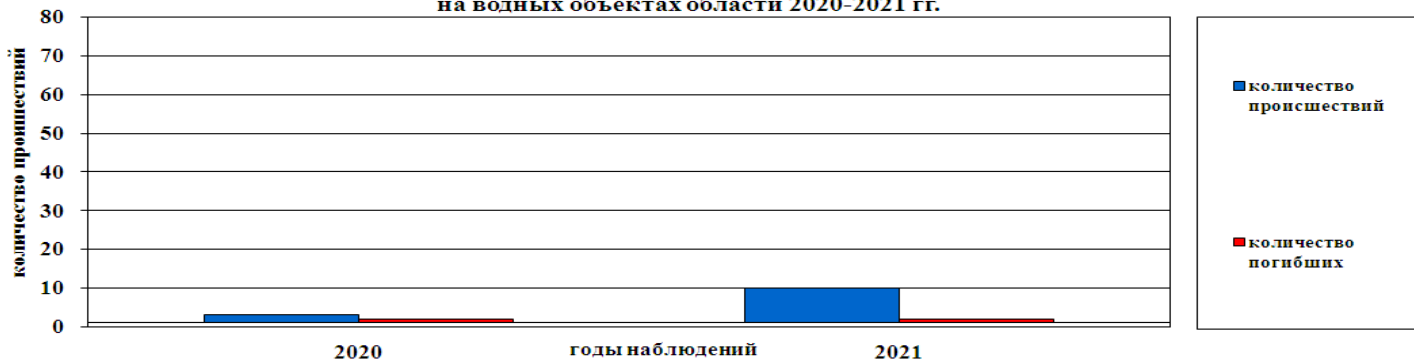
Сравнительный анализ происшествий, гибели людей на водных объектах области 2020-2021 гг.