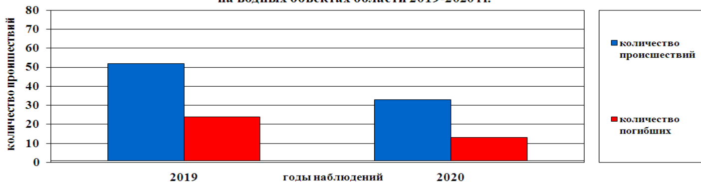
Сравнительный анализ происшествий, гибели людей на водных объектах области 2019-2020 гг.