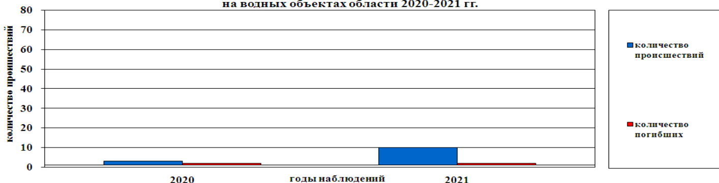
Сравнительный анализ происшествий, гибели людей на водных объектах области 2020-2021 гг.