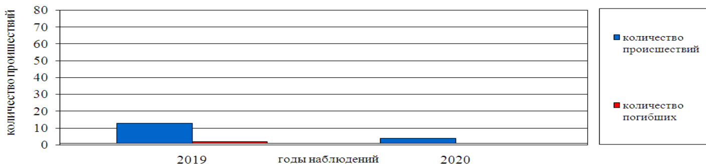
Сравнительный анализ происшествий, гибели людей на водных объектах области 2019-2020 гг.